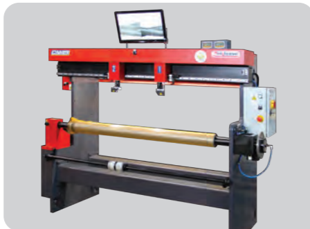
IRISLEEVE 1400 E