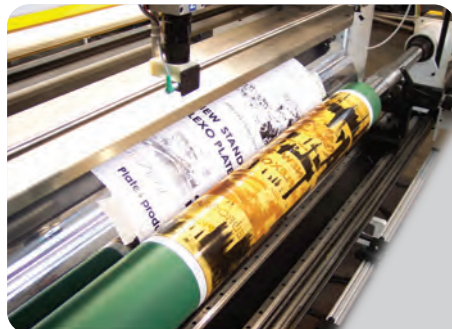
IRIFLEX WITH PROOFING