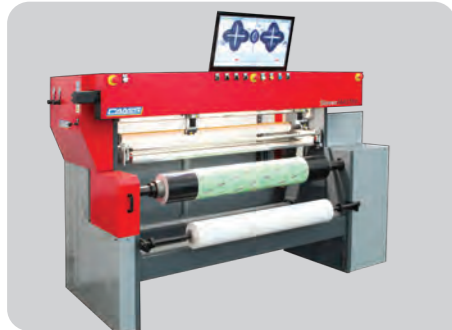
SLEEVE MASTER HD