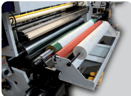
TAPER SLIDE - TAPER APPLICATOR